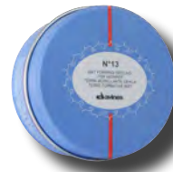
N°13 Mat Forming Ground