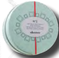
N°2 Mat Moulding Gesso