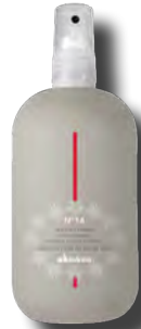
N°14 Sea Salt Primer